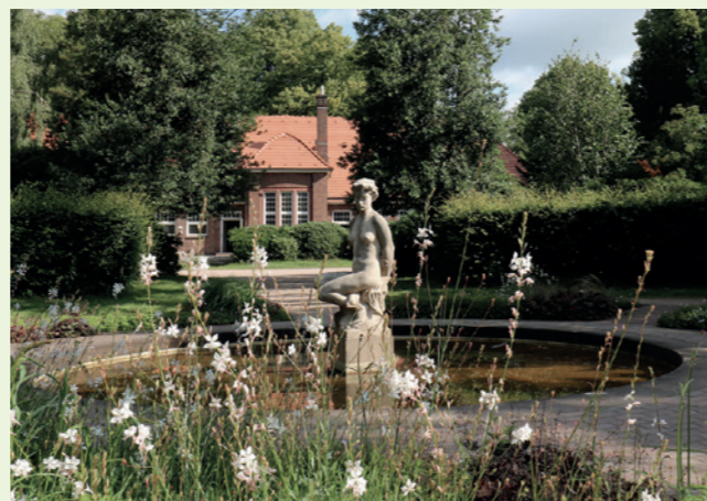
Frauenfigur von Albert Woebecke