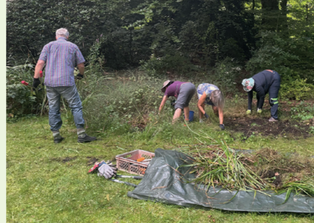
Freiwillige bei der Gartenarbeit