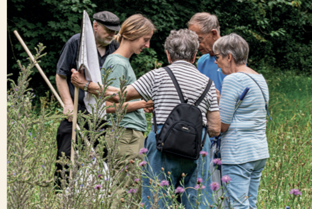
Flächenmonitoring mit Ökologie-Interessierten