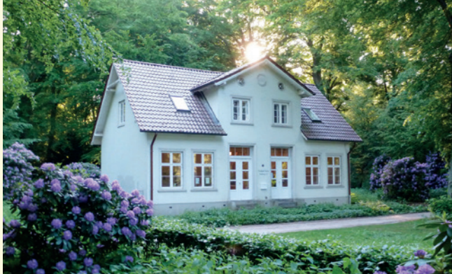
Das Sierichsche Forsthaus