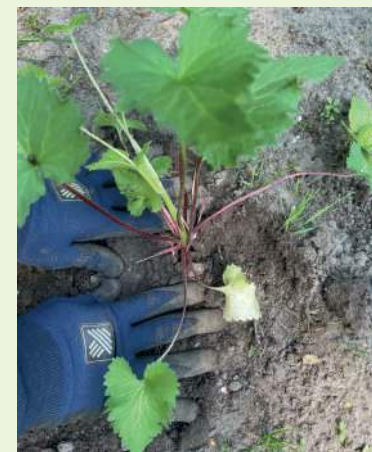
Ehrenamtliche beim Pflanzen von Glockenblumen.