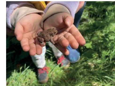
Rund um die Ententeiche leben zahlreiche Erdkröten.