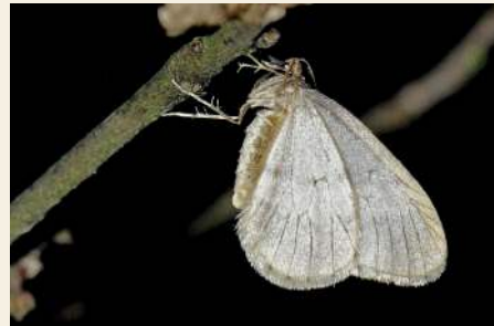
Kleiner Frostspanner