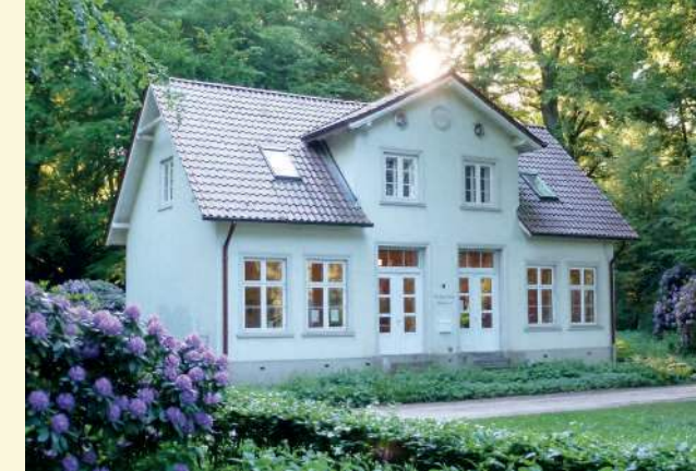
Das Sierichsche Fortshaus